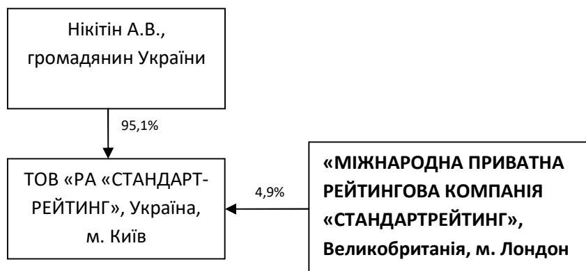
Рис. Схема структури власності ТОВ «РА «СТАНДАРТ-РЕЙТИНГ» відповідно до даних ЄДР ЮОФОПГФ